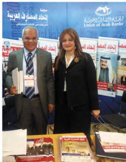
جناح اتحاد المصارف العربية