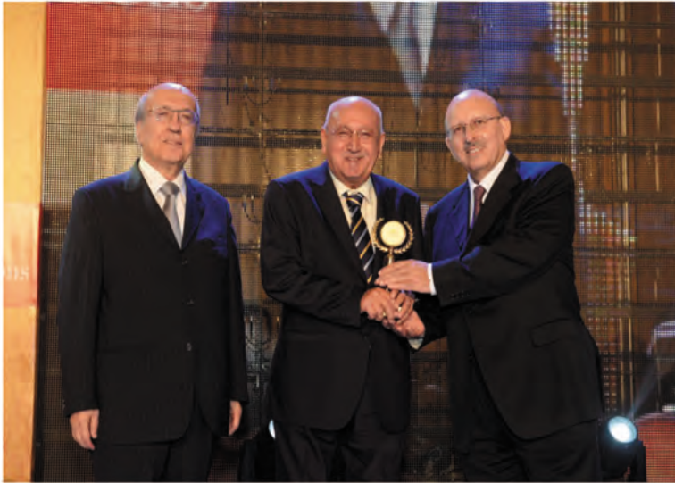
تكريم المدير التنفيذي لرابطة المصارف الخاصة في العراق

الصغيرة والمتوسطة في الدول العربية كي تلعب دوراً اقتصادياً وتتموياً أكبر وتؤمن فرص عمل أكثر للمواطنين.