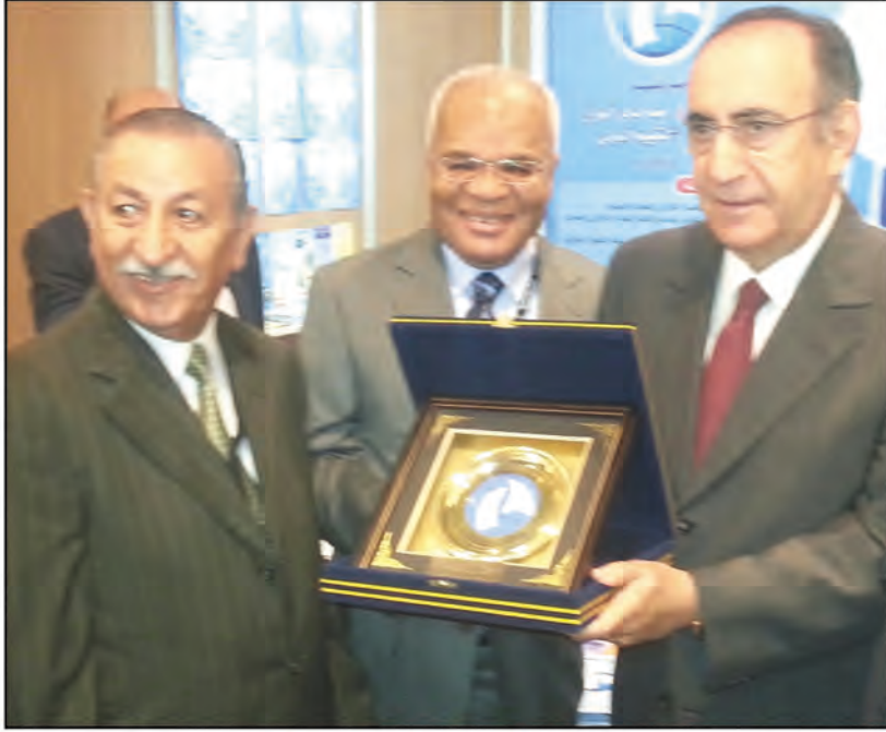
درع مصرف الخليج التجاري لراعي المؤتمر

شارك مصرف الخليج التجاري في المؤتمر المصرفي العربي السنوي لعام ٢٠١٣ والذي يقيمه إتحاد المصارف العربية في بيروت تحت شعار ( التفاعيات الاقتصادية للتحويلات العربية - الإصلاحات ودور المصارف).