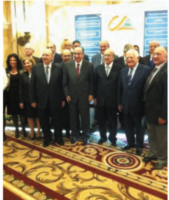
جاناب من الحضور في المؤتمر