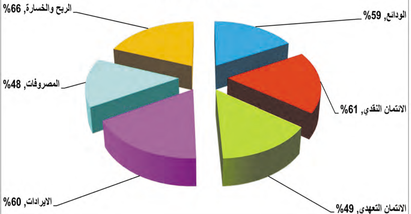
نسب النمو (%) لشهر تشرين (2) لعامي 2012 و 2013