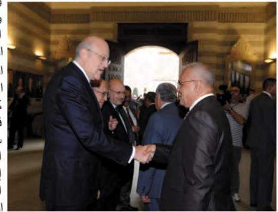
دولة رئيس الوزراء اللبناني يستقبل اعضاء المؤتمر