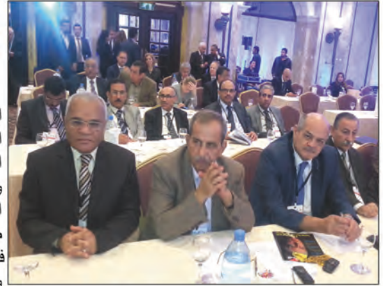
وفد مصرف الخليج التجاري في المؤتمر