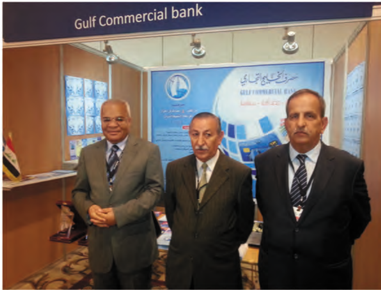
وفد مصرف الخليج التجاري