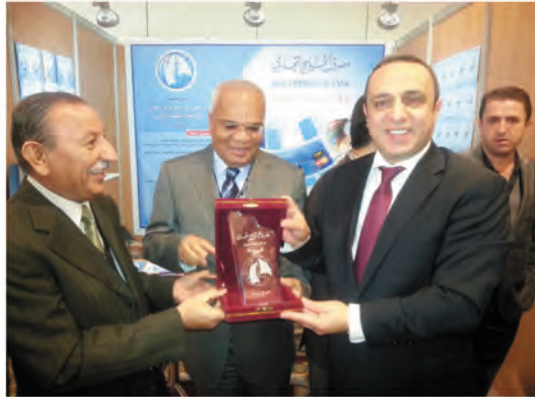
درع مصرف الخليج الى الامين العام لاتحاد المصارف العربية

وقد اجري مصرف الخليج التجاري لقاءات مع جميع المصارف العربية المساهمة في المؤتمر بهدف عقد الاتفاقيات وتبادل الخبرات والتعاون المصرفي العربي ورسم خارطة طريق لحركة الاستثمار والتمويل فيما بين الدول العربية .