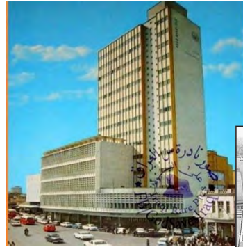
مصرف الرافدين في بغداد... بين الامس واليوم